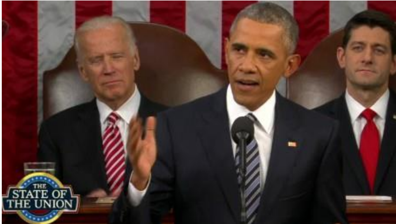
Obamas “State of the Union”-tale 12. Januar 2016

“For the loved ones we’ve all lost, for the family we can still save, let’s make America the country that cures cancer once and for all ”